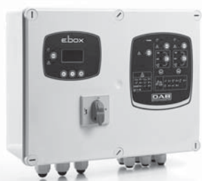
e.box plus D